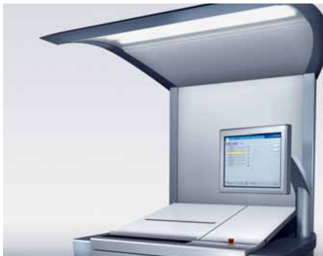
Prinect Press Center: la perfecta central de control y de manejo para la Speedmaster SM 52 con Anicolor.

Prinéctese. Prinect® es el flujo de trabajo para las imprentas de Heidelberg® desarrollado para obtener una integración amplia de todos los procesos de producción y de gestión. Prinect optimiza y automatiza los ciclos de producción, los simplifica y les aporta transparencia utilizando como base un formato de datos abierto, el documento JDF central, en el que hay contenida toda la información de un trabajo. Prinect está compuesto por módulos de hardware y de software y puede adaptarse con flexibilidad a las necesidades individuales de la empresa gráfica. Con Prinect, Heidelberg es el único fabricante que ofrece un flujo de trabajo para la empresa gráfica que integra y controla el proceso completo de producción de los impresos: Prinect le lleva directamente a la producción de impresos del futuro.