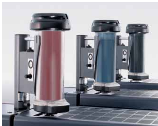
Las tintas de la gama Saphira están perfectamente adaptadas al grupo entintador Anicolor.

Una amplia gama de tintas especiales. Las tintas especiales se clasifican según el sistema PMS de Pantone® y están perfectamente adaptadas, por tanto, al grupo entintador reducido Anicolor. Los ajustes de color pueden realizarse aplicando las muestras de colores de Pantone. En comparación con los colores especiales tradicionales, el grosor de capa que necesitan se ha reducido y su unificación es ahora más amplia. Además de las ventajas a nivel técnico, esto también ofrece unas ventajas en el secado.